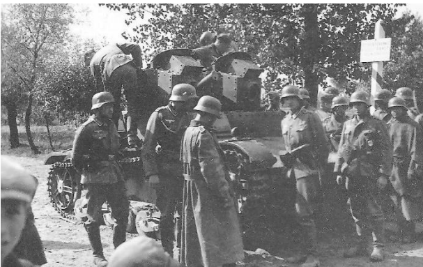
Polen 1939: Soldaten der deutschen 1. Gebirgs-Division betrachten an der slowakisch-polnischen Grenze einen erbeuteten 7TP (mit zwei Türme) der polnischen Armee.

Der 7TP war ein polnischer leichter Panzer mit einem Gewicht von 9,9 t und einem spezifischen Bodendruck von 0,6 kg/cm 2 . Das Fahrzeug stand in zwei Grundversionen zur Verfügung: die mit zwei MG-Türmen ausgerüstete Variante 7TPdw und die Variante 7TPjw mit einer 37-mm-Kanone in einem größeren Turm sowie einem achsparallelen MG. Der Kommandant des 7TP verfügte über den damals neuartigen, um 360° drehbaren Winkelspiegel MK.IV zur Gefechtsfeldbeobachtung unter Panzerschutz