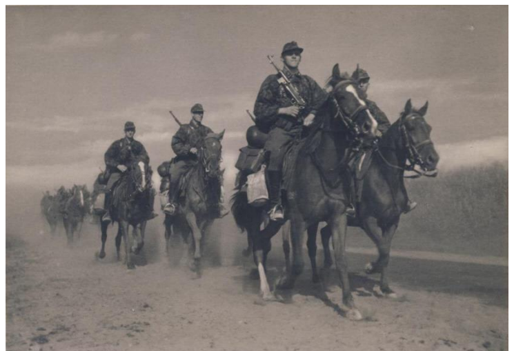
Sammelbild der SS-Division Florian Geyer

Wohlauf, Kameraden, aufs Pferd, aufs Pferd! Ins Feld, in die Freiheit gezogen. Im Felde, da ist der Mann noch was wert, Da wird das Herz noch gewogen. Da tritt kein Anderer für ihn ein, Auf sich selber steht er da ganz allein.