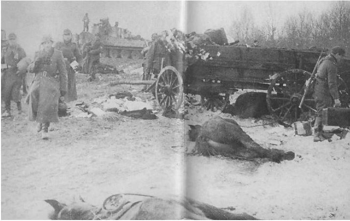
Flucht aus dem Osten des Reiches

waren weniger als 30% stark und kämpften an zwei Fronten. In Kowel [Nordwestukraine] zum Beispiel versuchten die Sowjets an der Front, die Stadt einzukesseln, während Partisanen in unserem Rücken und sogar in der Stadt selbst für Verwüstung sorgten.