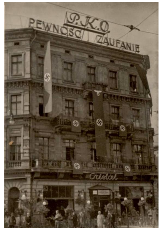
Krakau während der Besatzungszeit