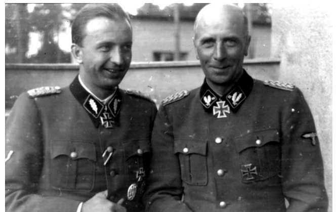
SS-Brigadeführer Wilhelm Bittrich (rechts) und SS-Standartenführer Hermann Fegelein am 21. Juni 1942 an der Ostfront