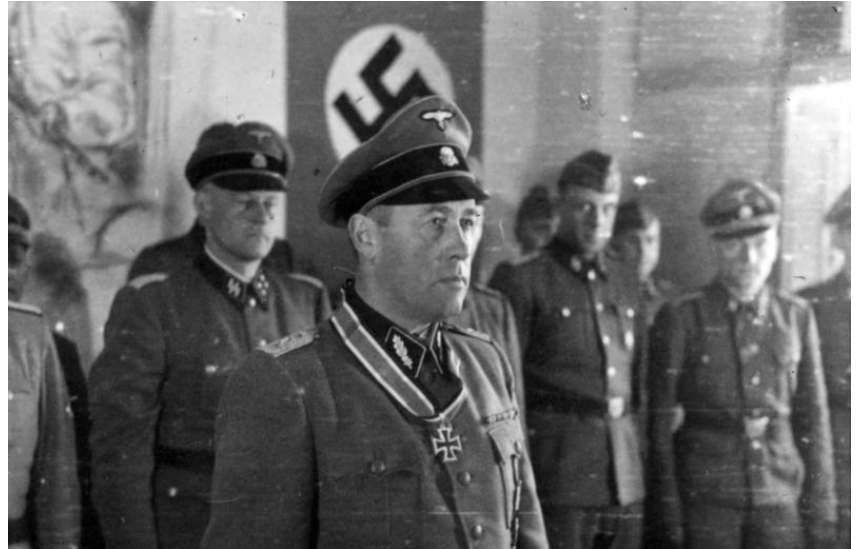
Gustav Lombard am 10. März 1943 anlässlich der Verleihung des Ritterkreuzes

Ohne auf Befehle zu warten, beschloss Lombard, durch den Wald nördlich von Beloussewo vorzustoßen. Er und seine Männer überrannten schwache feindliche Sicherheitskräfte am Nordrand des Waldes und griffen in den Nachtstunden mit Hilfe des Mondlichts weiter an. Auf diese Weise erlangte SS-Obersturmbannführer Lombard für sein Regiment günstige Positionen, die es ihm ermöglichten, die erreichte Linie zu sichern. Dadurch wurde der rechte Flügel der 2. Lw.F.Div. gestützt und daran gehindert, weiter aufgerollt zu werden (was sonst unvermeidlich gewesen wäre, da die Linien der eigenen Truppen bereits 15 km tief durchbrochen worden waren und keine nennenswerten eigenen Kräfte zur Verfügung standen, um einen weiteren feindlichen Vorstoß aufzuhalten).