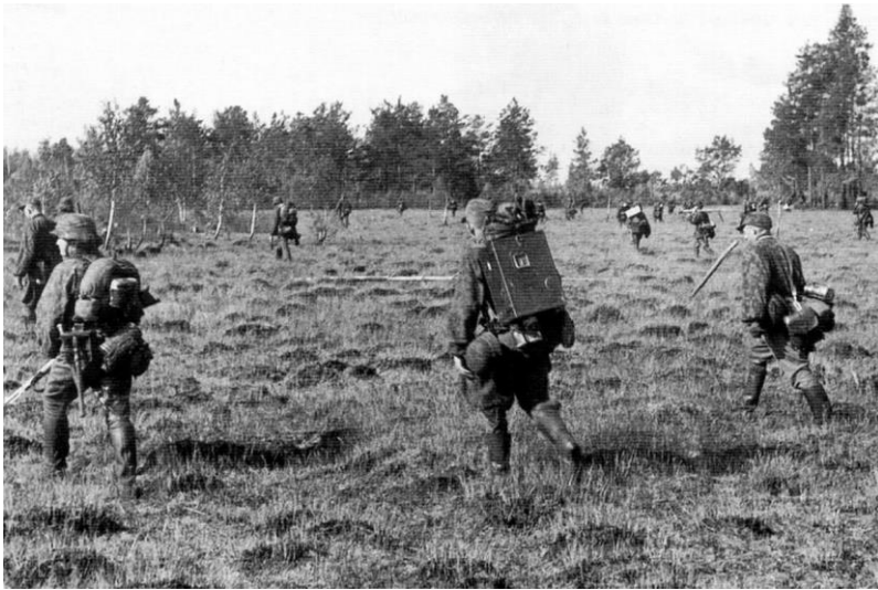
Mai 1943 Partisanenbekämpfung im sogenannten 'nassen Dreieck' bei Mosyr - die SS-Reiter beginnen den Vormarsch durch versumpfte Felder und Wälder

Gefangene wurden freigelassen; viele schlossen sich uns im Kampf gegen Russland an, ihrem alten Feind. Viele weitere kamen ins Reich, um freiwillig für gutes Geld zu arbeiten, was in den Geschichtsbüchern wieder einmal vergessen wird.