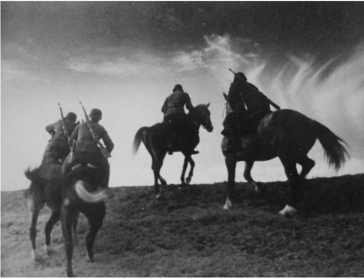
Jugoslawien 1943: Ein berittener Aufklärungstrupp der WSS-Kavallerie-Division (Ab März 1944 "Florian Geyer") während eines Einsatzes in Kroatien.

allerdings selten und sehr schwierig, aber später, als die wahre Natur des Partisanenkrieges klar wurde, begnadigte man viele unserer Männer und reduzierte ihre Strafen erheblich.