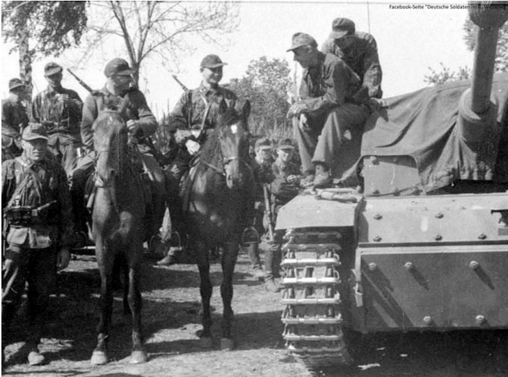
Südrussland im September 1943: Reiter und ein Stug III Ausf. G der 8. WSS-Kavallerie-Division "Florian Geyer" (zu diesem Zeitpunkt der Heeresgruppe Süd unterstellt).

Ein SS-Scharführer in meiner Kompanie erhielt das Eiserne Kreuz dafür, dass er einen T-34 mit seinem Pferd verfolgte, an Bord kletterte, die Luke öffnete und eine Granate hineinwarf. Er hätte getötet werden können, aber er sprang vom Panzer ab, rannte zu seinem Pferd und zurück zu unserer Position,